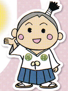
静岡県社会福祉人材センター イメージキャラクター 「ふくしんぼうし」